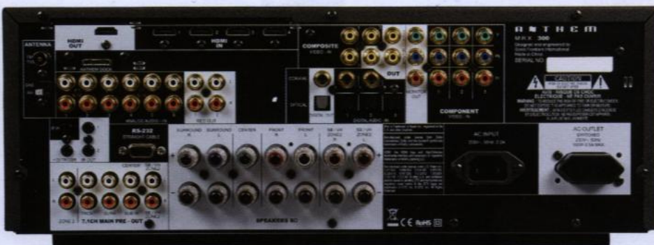
Jeśli czegoś brakuje, to tylko Ethernetu.

domowego. Anthem poszedł dalej, bowiem do MRX-300 dołączył spory mikrofon, rozkładany statyw, zestaw kabli oraz aplikację na płycie CD.