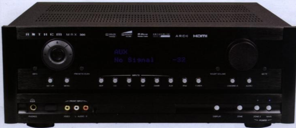
MRX-300 z wyglądu przypomina dalekowschodnie amplitunery sprzed dekady.

Główną atrakcją MRX-300 jest system Anthem Room Correction (ARC), służący do automatycznego ustawiania parametrów sygnału z uwzględnieniem warunków akustycznych pomieszczenia. Własne systemy automatycznego setupu, składające się zazwyczaj z małego mikrofonu podłączanego do amplitunera, stosują już wszyscy liczący się producenci kina