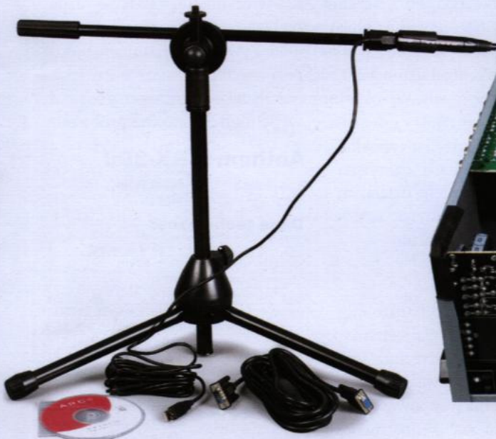
W prezencie System Anthem Room Correction.